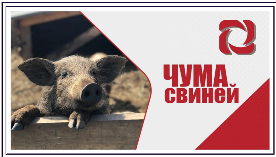
Памятка населению - Африканская чума свиней

Африканская чума свиней (лат. Pestis africana suum ), африканская лихорадка, восточноафриканская чума, болезнь Монтгомери— высококонтагиозная вирусная болезнь свиней, характеризующаяся лихорадкой, цианозом кожи и обширными гемorragиями во внутренних органах. Относится к списку А согласно Международной классификации заразных болезней животных. Для человека африканская чума свиней опасности не представляет!!! Употреблять в пищу свинину безопасно, поскольку вирус погибает при термической обработке в 70 градусов.